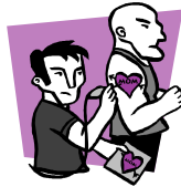
Hacerse un tatuaje